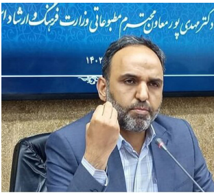
دکترنوی پورسازانمستقیم معاونان وزارت فرهنگ ارشاد اسلامی