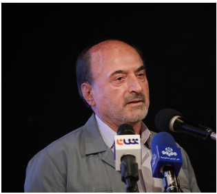
معاون وزیر نفت: